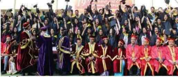
गज केसरी युग